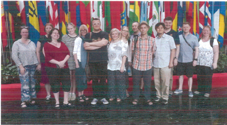
Hópurinn í heimsókn í höfuðstöðvum Hanban í Beijing