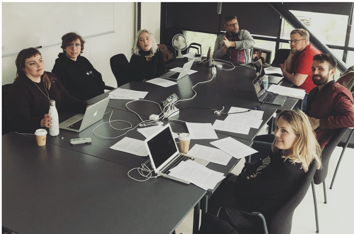
Fyrsti vinnufundur Myndvísis sumarið 2020